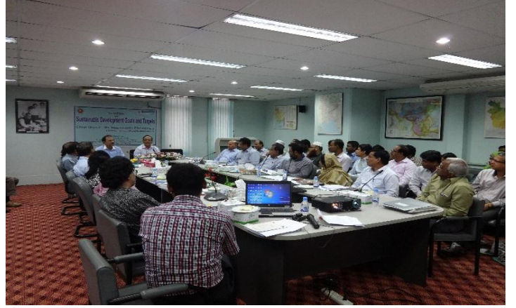
হাইড্রোকার্বন ইউনিট কর্তৃক আয়োজিত নিয়মিত সেমিনারের একাংশ

অংশগ্রহণ ও মতামত প্রদান করে আসছে। Mini Data Bank-এ গ্যাস মজুদ, অনাবিষ্কৃত গ্যাস সম্পদ, গ্যাস উৎপাদন সংক্রান্ত ডাটা সংরক্ষণের পাশাপাশি ডাটাবেজ থেকে “Gas Reserve and Production“ শীর্ষক মাসিক প্রতিবেদন প্রকাশ হচ্ছে। এছাড়াও মাসিক গ্যাস উৎপাদন এবং খাতওয়ারী মাসিক ব্যবহারের উপাত্তের উপর ভিত্তি করে “Annual Gas Production and Consumption“ শীর্ষক বার্ষিক প্রতিবেদন প্রণয়ন করা হচ্ছে।